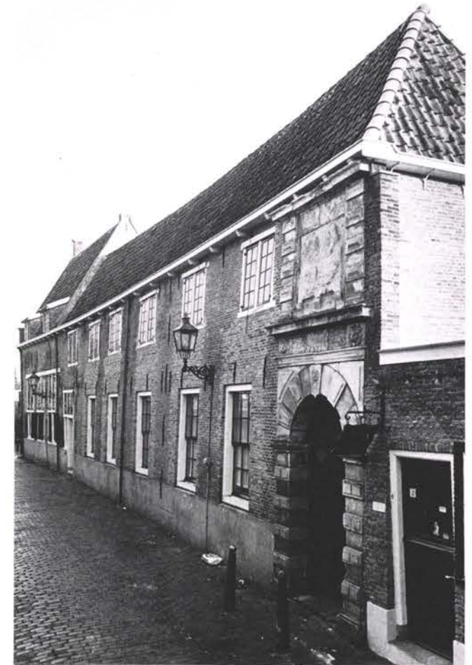
Wisselstraat nrs. 10, 8