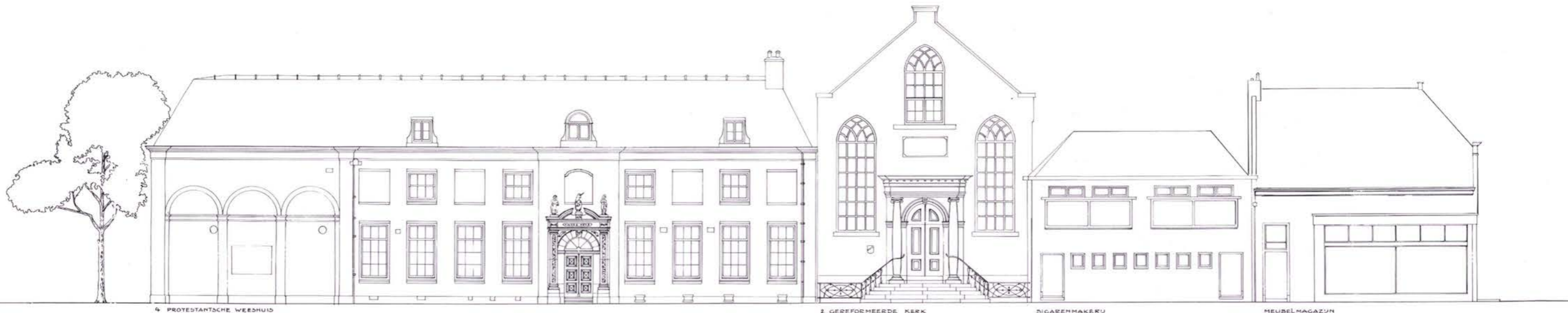
4 PROTESTANTSCH E WEE SHUIS

MARIAKLOOSTER 1408. WEE SHUIS 1574 POORTJE 1620. GEDENKSTEEN 1848. METSELWERK XIX