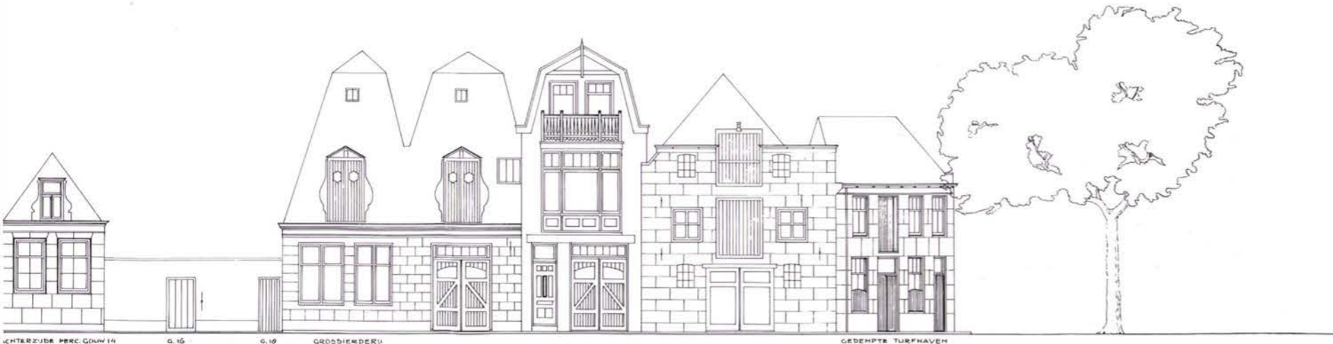
CHTERZIJDE PERC. GOUW 14