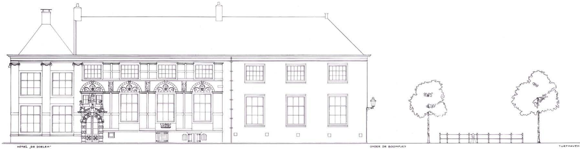
A° 1585 AFGEBOROKEN 1773. DAARNA NIEUW OPGEBOUWD