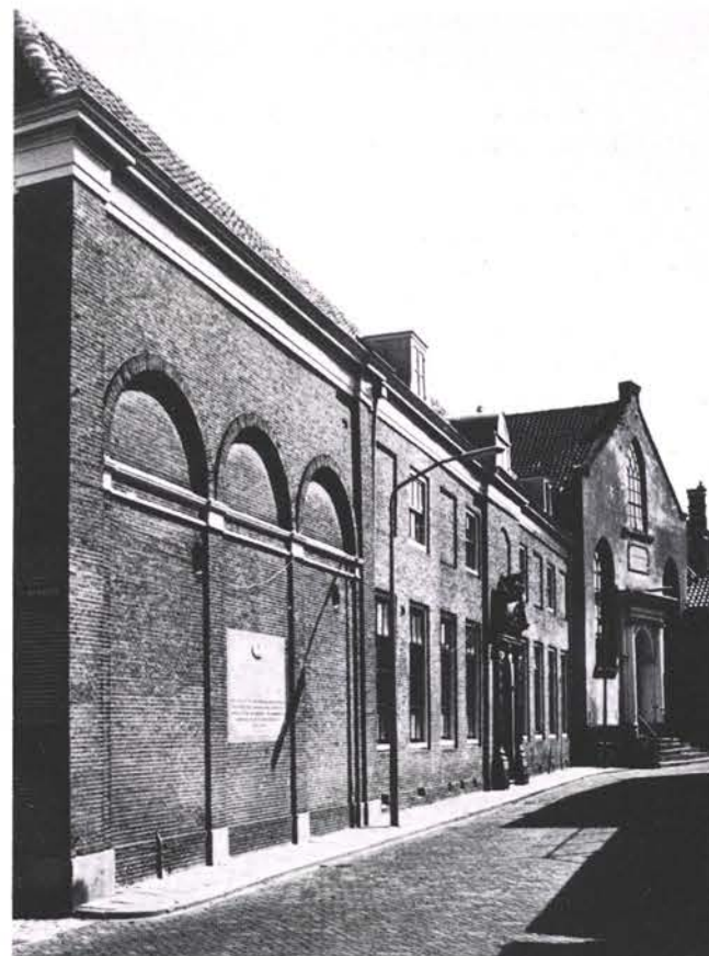
Korte Achterstraat nrs. 4, 2

Hervormd Weeshuis, twee vleugels aan een binnenhof, waarvan de ene straatwand vormt aan de Korte Achterstraat (ingangsportaal uit 1729) en de andere met een blinde muur langs het open gedeelte van de Turfhaven loopt. Deze vleugel bestaat uit een 16de eeuwse gedeelte begrensd door een topgevel, die later bij uitbreidingen in de 18de eeuw is ingebouwd; het hoekgedeelte is in 1848 vernieuwd. Inwendig in de lange vleugel regentenkamer en gang met enig stucwerk 18de eeuw. Bronzen offerblok op hardstenen pedestal. In de tuin hardstenen pomp, twee loden beelden van weeskinderen en een houten eenhoorn. Gedenksteen in de gevel Korte Achterstraat.