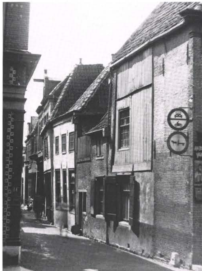
Grote Havensteeg, vóór 1960

Tussen haakjes zijn de nummers van voor 1909 vermeld.