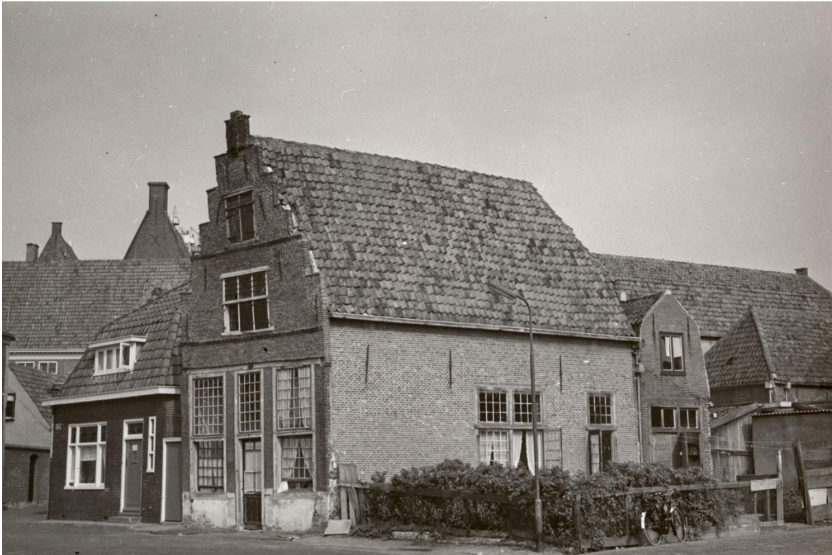
Kuil 32 – 1959

Dit pand met een sobere Renaissance bakstenen trapgevel is een Rijksmonument. Reeds in 1929 werd het op de gemeentelijke monumentenlijst geplaatst. Sinds 1965 is het eigendom van de Vereniging Hendrick de Keyser. Na onderzoek gaat de vereniging ervan uit dat het pand rond 1625 gebouwd moet zijn.